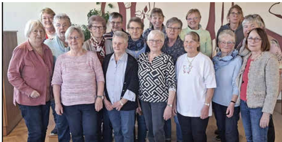
Die Teams „Café Volkening“

Impressum: Der Gemeindebrief wird vom Presbyterium der Ev.-Luth. Kirchengemeinde Petershagen herausgegeben. Er erscheint dreimal im Jahr: zu Ostern, zum Herbst und zum Advent. Der Gemeindebrief wird kostenlos in der Gemeinde verteilt. Wenn Sie spenden möchten, bitte unter dem Stichwort „Kirchengemeinde Petershagen“ auf das Konto des Kirchenkreises Unsere Bankdaten: Kirchengemeinde Petershagen DE 04 47860125 0601745200 Auch Mitarbeit, Leserbriefe und Zuschriften sind willkommen, gern per E-Mail an folgende Adresse: monika.krause53@gmx.de .