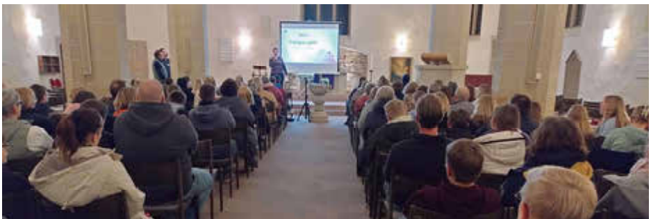
Foto vom Infoabend am 02.03.26 in der Peterikirche.

Die Konfirmationen werden weiterhin zu den traditionellen Terminen in den jeweiligen Gemeinden stattfinden, sofern die Konfirmandinnen und Konfirmanden keine davon abweichende Gemeinde angeben.