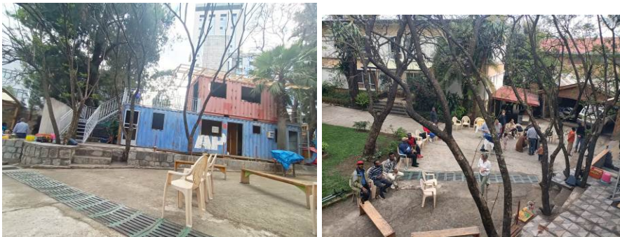
Das Backhaus (blau) mit Gästehaus (rot) und Blick vom Gästehaus auf den Platz zwischen Backhaus und Pfarrhaus.

Vor zwei Wochen wurde in Addis Abeba das Richtfest des Backhauses gefeiert. Wir sind gespannt, wie es dort weitergeht.