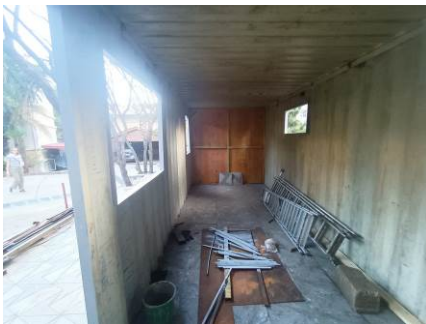
So sieht's im Backhaus aus. Es fehlen noch Fenster und Türen. Die Maschinen und Küchenmöbel sind bereits bestellt.