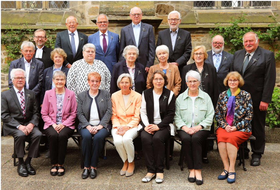
Diamantene Konfirmation - 60 Jahre