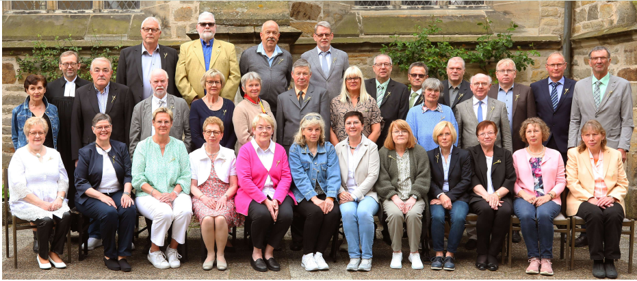
Goldene Konfirmation - 50 Jahre