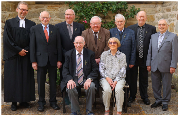
Gnadenkonfirmation 70 Jahre