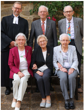
Kronjuwelenkonfirmation 75 Jahre