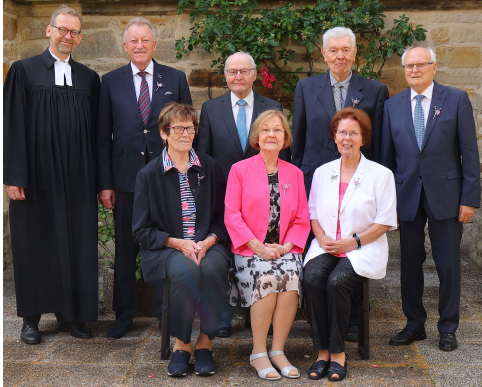
Eiserne Konfirmation 65 Jahre