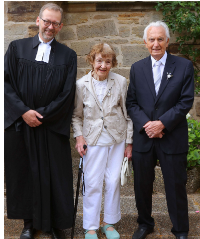
Eichen-Konfirmation 80 Jahre